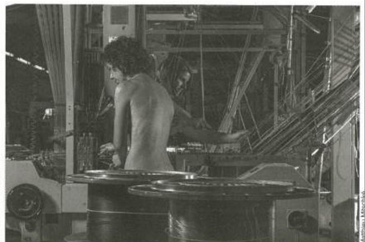
Société choletaise de fabrication (SCF) à Bégrolles.