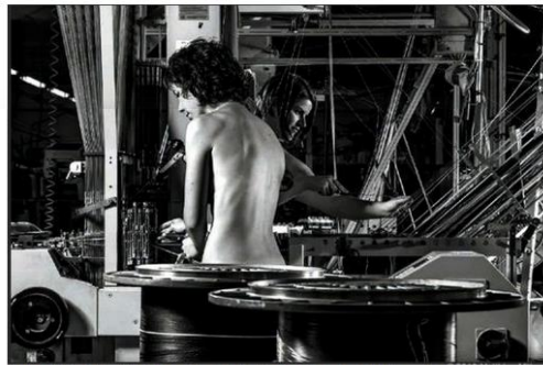
Enfileuses à la Société Choletaise de fabrication à Bréolles-en-Mauges

Et SVP prenez la légende des "Enfileuses" au premier degré.