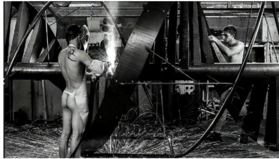
Des métalliers de chez BM Métallerie à Saint-André-de-la-Marche.

Par Xavier Colombier | Publié le 29/11/2013 | 10:52